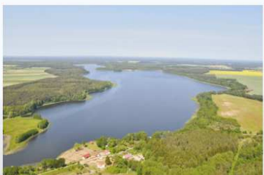
Jezioro Szczytno z lotu ptaka

Stacja rowerowa Kleśnik (obwód Pawłówek, gmina Przechlewo). Stacja położona jest nad brzegiem rynnowego jeziora Szczytno na północnym skraju Pojezierza Krajeńskiego (Obszar Chronionego Krajobrazu Jezior Kępско i Szczytno). Na jeziorze znajduje się Wyspa Zamkowa (Góra Zamkowa), na której od XI do XII w. istniał gród, z początku siedziba władców Pomorza, później kasztelania szczywieńskiego. Naprzeciw wyspy, na prawym brzegu widać Górę Szubieniczą (143 m n.p.m.), dawne miejsce straceń. W pobliżu jeziora znajduje się rezerwat przyrody „Osiedle Kormoranów”. Przez jezioro przepływa Brda stanowiąca szlak kajakowy. Akwen jeziora jest połączony z jeziorami Końskim, Kępско i Szczytno Małe, stanowiąc zespół jezior szczywieńskich. Miejscowościami nadbrzeżnymi są: Kleśnik, Pakońtulsko i Koprzywnica. Dane morfometryczne: powierzchnia - 645,2 ha, głębokość maksymalna 21,4 m, głębokość średnia 8,0 m, długość maksymalna 8500 m, szerokość maksymalna 1180 m. Ichtofauuna: w akwenu tym dominuje leszcz, płoć, lin, karp, wzdręga, a wśród gatunków drapieżnych: szczupak, okoń, węgorz.