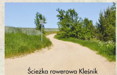
Ścieżka rowerowa Kleśnik