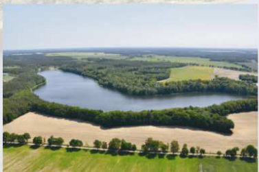
Jezioro Końskie z lotu ptaka