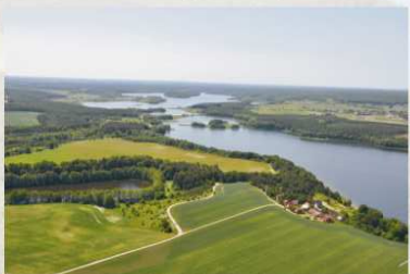
Stacja rowerowa z lotu ptaka