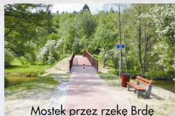
Mostek przez rzekę Brdę